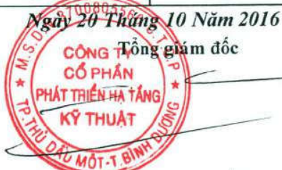
ĐỖ QUANG NGÔN