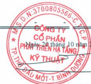
ĐỖ QUANG NGỒN