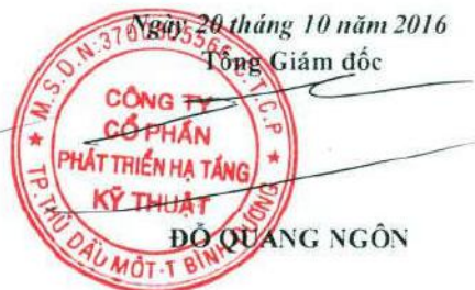
ĐỖ QUANG NGÔN